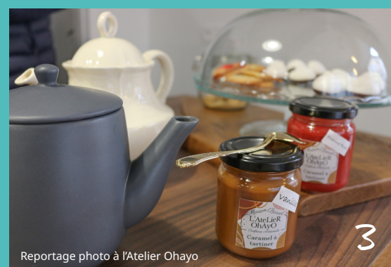
Reportage photo à l'Atelier Ohayo