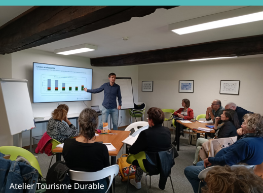
Atelier Tourisme Durable