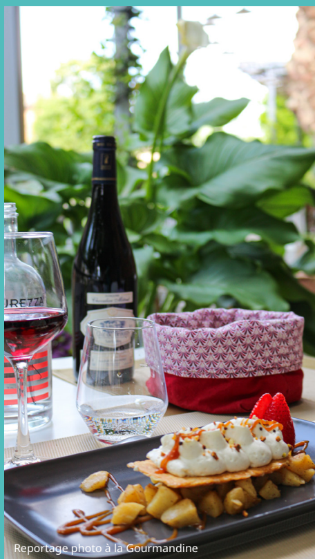
Reportage photo à la Gourmandine