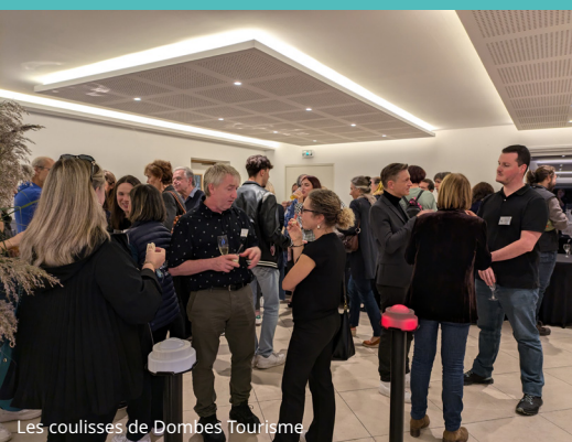
Les coulisses de Dombes Tourisme