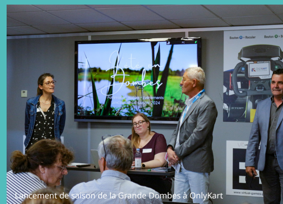
Lancement de saison de la Grande Dombes à OnlyKart