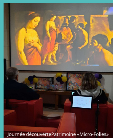
Journée découverte Patrimoine «Micro-Folies»

Le p'tit truc en plus Nos visites guidées sont gratuites pour vous !